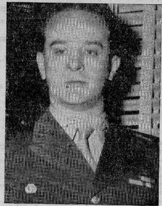
Coronel Jacobo Arbenz Guzmán

el calificativo de "comunista" aquí tampoco está bien aplicado, pues es un hombre de muchísimos méritos para que sea adicto a tan desprestigiada doctrina, enemiga en todos los aspectos de la democracia, de la decencia y de la seguridad humanas.