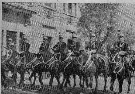
Vista parcial del Cuerpo de Caballería de la Politécnica

Los alumnos, que desde el primer momento son considerados como Cadetes del Ejército reciben la instrucción necesaria a Oficiales de Infantería, Caballería, Artillería e Ingenieros.