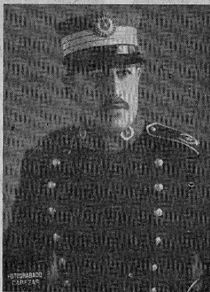
Coronel Enrique Peralta Azúrra

Subdirector y Director de la Escuela Politécnica durante los años de 1940 a 1945, posiciones en las que conquistó los más altos merecimientos y el afecto profundo de Oficiales y Cadetes. Su nombre es recordado en la Escuela con verdadero respeto y admiración. Luego, fué también Jefe Político y Comandante de Armas en Totonicapán, y hasta la fecha, ha ejercido en Sur y Centroamérica la carrera diplomática con verdadero acierto, encontrándose actualmente en Costa Rica en calidad de Agregado Militar de la Embajada.