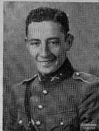
Coronel Daniel Coronado Urrutia, actual Gobernador de La Antigua, graduado de la Escuela Politécnica de Guatemala

Álgebra superior — Geometría del espacio — Descriptiva con extensión — Geometría analítica — Cálculos diferencia e integral — Planos acotados — Mecánica racional — Mecánica explicada — Física experimental — Química inorgánica — Materiales de Construcción — Mecánica de las construcciones — Caminos de hierro y ordi-