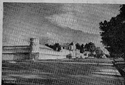
Vista Exterior de la Escuela Politécnica de Guatemala