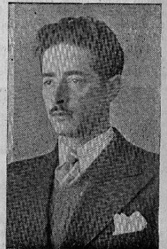
Lic. Mario Monteforte Toledo Diputado al Congreso Constituyente y escritor de gran fama