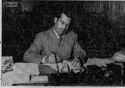
Coronel Aldana Sandoval Ministro de Comunicaciones cuya labor ha sido brillante, habiendo merecido en todo momento la suprema confianza de gobierno y pueblo