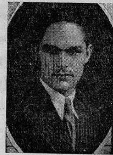
Contador Don Alfonso Padilla Ministro de Hacienda cuyos conocimientos hacendarios han hecho posible el resturamiento de la Economía guatemalteca