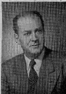
Lic. Arturo Herbruger Presidente del Poder Judicial